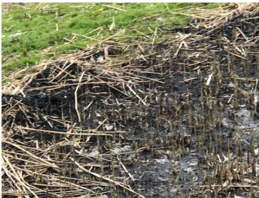
(Belegbild vom 07.04.2019)